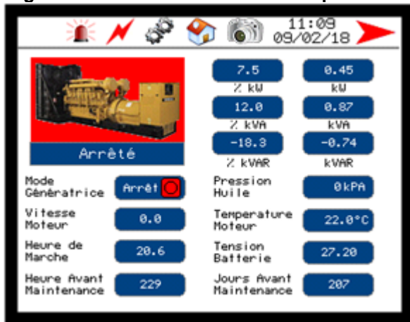
Page de SUPERVISION/CONTRÔLE par défaut